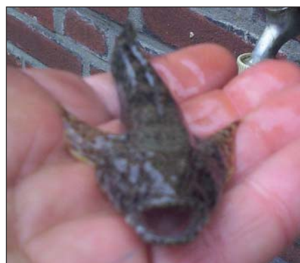
Fig 1 & 2: Kesslers grondel gevangen & gefotografeerd door Dick van Mourik; voor verdere foto's zie www.waarneming.nl